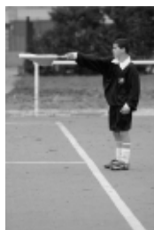
au milieu du terrain