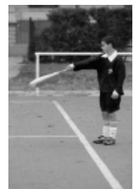
du côté opposé à l'assistant